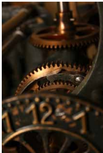
Das Uhrwerk unserer Kirchenglocke sieht ähnlich aus wie dasjenige in Stettlen.