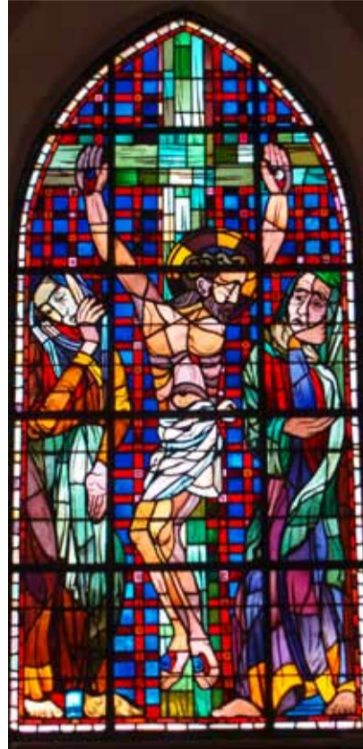
Karfreitagfenster in der Kirche Messen von Max Brunner, technische Ausführung von L. Halter, Bern.