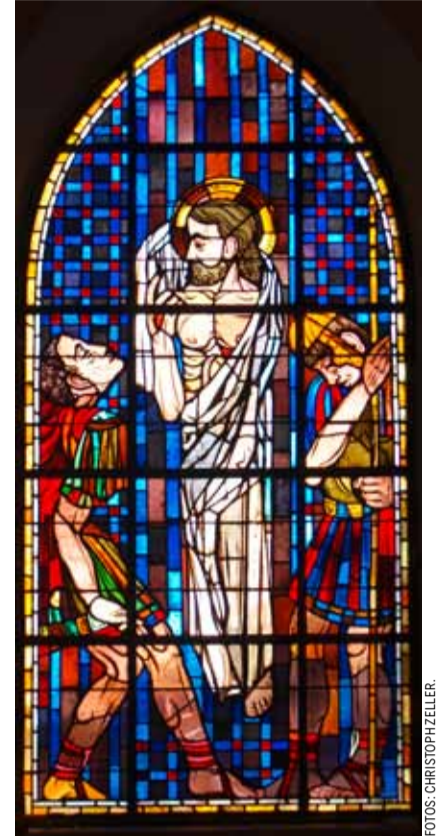
Osterfenster in der Kirche Messen von Max Brunner, technische Ausführung von L. Halter, Bern.