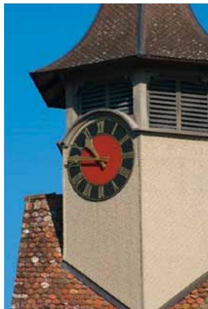
Der Kirchturm Bätterkinden.