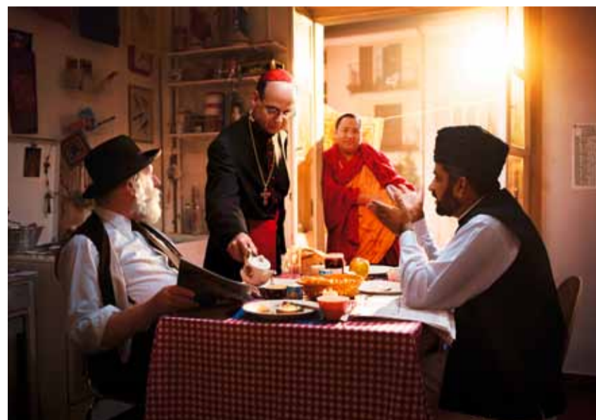
Im Haus der Religionen in Bern wird interreligiöser Dialog gelebt, schweizweit setzt sich IRAS COTIS, die Interreligiöse Arbeitsgemeinschaft in der Schweiz, für ein friedliches Zusammenleben der Religionen ein.

Hindus feiern dort unter einem Dach in ihren eigenen Räumen neben Muslimen, Buddhisten und Christen ihre Gottesdienste. Barfuss haben wir den Hindutempel und die Moschee betreten. Mit Schuhen die christliche Kirche, obwohl die äthiopischen Christen, die dort ihre Gottesdienste feiern, den Kirchenraum ebenfalls nur barfuss betreten. Beindruckt haben mich Entscheidungen, die getroffen werden mussten: die Ausrichtung der Moschee Richtung Mekka in einer vorgegebenen Gebäudehülle oder die Arbeiten der hinduistischen Tempelbauer, die – entgegen der Suva-Vorschriften – barfuss ihre Bauarbeiten verrichten wollten. Mit Erstaunen habe ich erfahren, dass oft nicht der Dialog unter den Religionen und ihren Verantwortlichen schwierig ist, sondern der innerkonfessionelle Dialog zwischen unterschiedlichen islamischen oder hinduistischen Glaubensrichtungen.