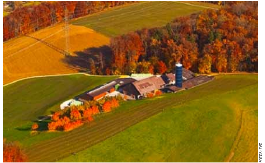
Schär Weidhof Ormalingen.