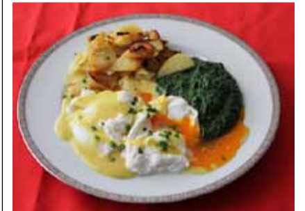
Verlorene Eier an Safransauce.

Verlorene Eier an Safransauce Bratkartoffel Spinat