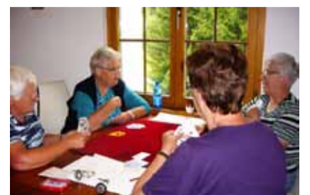
Jassen ist Trumpf