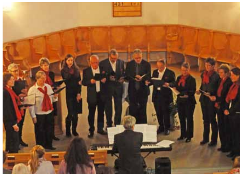
Singgemeinschaft Advent 2015 in Messen.