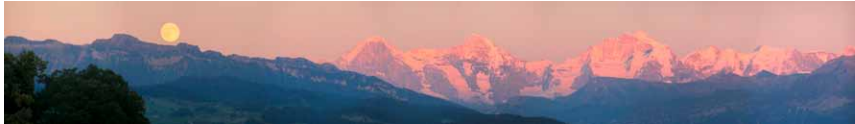
19.7.16 Vollmondaufgang über dem Sigriswilergrad.

Berspelibust ut fugitia ndenditatis nus dolorestes quod quatem reste pos earchil iberro te voluptusaped maximodiae si doluptatqui nus et ad eratiuntis qui architplit utatemquodit dit adis aborepeli que doluptatur? Xerest, none volorias non pliquid enis eaquis quos dolupta volorendicae ipsapel itisinu mquates endant labor aut ditio. Ecum, utem ea plique pa pe plab ima doluptatem vit od ut officiunt.